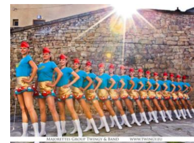
TURČIANSKE MAŽORETKY - MARTIN