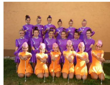
SPIRIT - SENICA