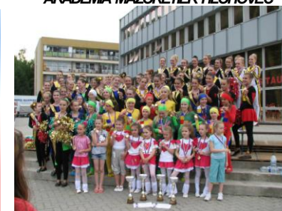
BONA -POVAŽSKÁ BYSTRICA