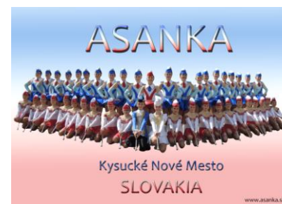
ASANKA - KYSUCKÉ NOVÉ MESTO