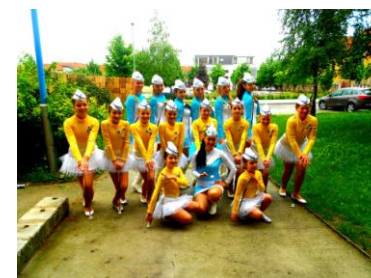
AKADÉMIA MAŽORETEK HLOHOVEC